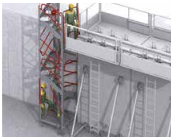
Mini Escalib pour accéder sur une banche