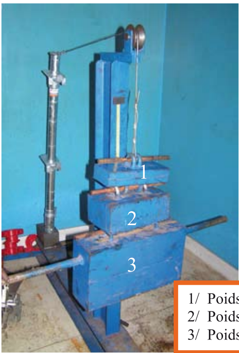
1/ Poids : 10 kg 2/ Poids : 30 kg 3/ Poids : 85 kg