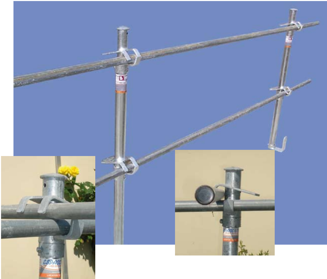
Essais du 16 Avril 2008 Conforme à la norme NF.P.93.340